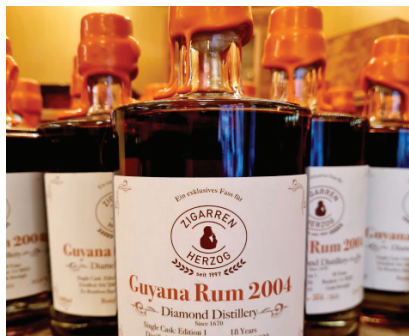
Zigarren Herzog - Guyana Rum 2004

gibt es seit 1670 und zählt damit zu den ältesten Brennhäusern überhaupt. Später bezahlte die British Navy ihre Matrosen unter anderem mit unverdünnten Guyana Rum in Fasstärke, weshalb wir heute noch die Bezeichnung „navy-strength“ verwenden, wenn wir über Rum mit über 54 % Volumen sprechen. Noch heute haben Navy-Blends einen Anteil Guyana Rum in ihrer Abfüllung. Damals befanden sich in Guyana mehrere hundert Brennereien, heute gibt es nur noch einen Betrieb, welcher das historische Erbe fortführt. Da es sich bei unserem Rum um eine Einzelfassabfüllung handelt ist die Flaschenanzahl stark limitiert. Alle Flaschen werden von Hand abgefüllt, etikettiert, versiegelt und nummeriert. Natürlich frei von jeglichen Zusätzen und authentisch Guyana. Er ist in all unseren Geschäften sowie online erhältlich. Preis: 138,00 Euro pro Flasche